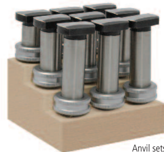
Anvil sets 300-400mm

Sets: Supplied with digital display unit, measuring head with exchangeable anvils and setting ring with UKAS certificate